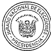
HUGO SIVINA HURTADO PRESIDENTE JURADO NACIONAL DE ELECCIONES