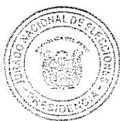
HUGO SIVINA HURTADO PRESIDENTE JURADO NACIONAL DE ELECCIONES