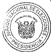
HUGO SIVINA HURTADO PRESIDENTE JURADO NACIONAL DE ELECCIONES